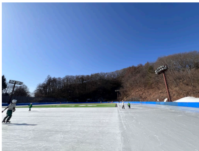
風越公園スケートリンク(冬季)