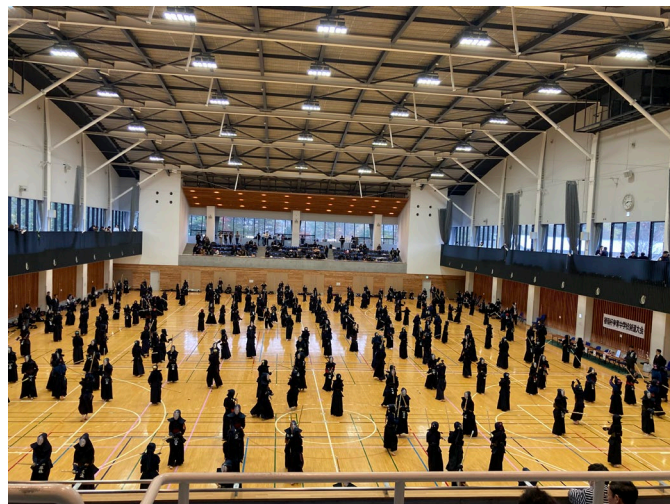
第33回榛嶺杯剣道大会