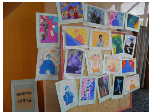
かるいざわ ざわざわ2025 作品展示の様子（自主事業）