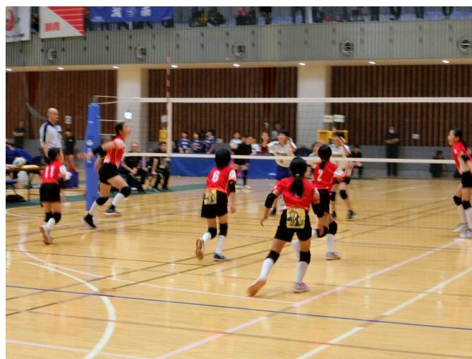
第45回全日本バレーボール大会小学生大会2025年度長野県大会