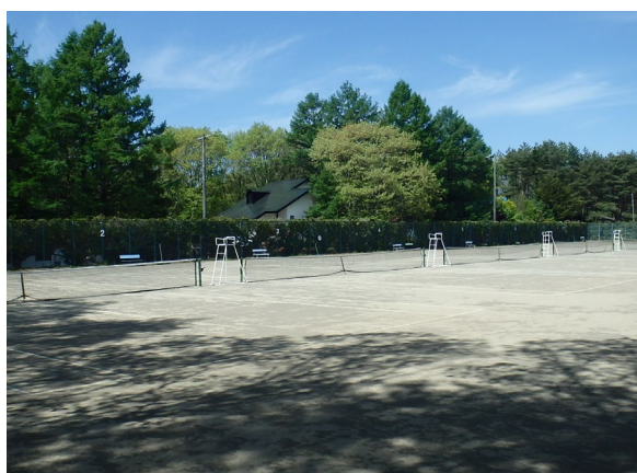
追分第2運動場テニスコート