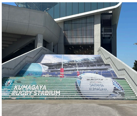
競技別NTC合同ミーティング（熊谷スポーツ文化公園ラグビー場）